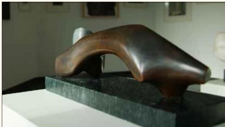
Sculpture de Maggy Stein